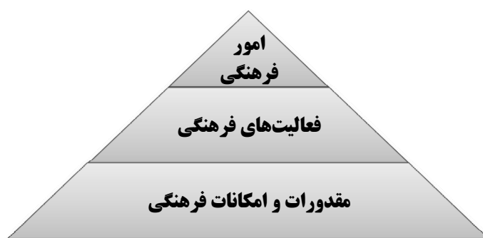
نمودار ۴. الگوی طبقه‌بندی «امور فرهنگی» برای سطح توسعه و کلان

اصلی فرهنگ است. فعالیت‌های فرهنگی (تدوین کتاب، تولید فیلم و...) که هدف آن تغییر در امور فرهنگی است در درجه دوم اهمیت و حساسیت قرار می‌گیرند و در مرتبه سوم، امکانات و مقدرات فرهنگی (نیروی انسانی، تجهیزات و...) مطرح است که وسیله‌ای برای انجام فعالیت‌های فرهنگی است. تقدم این مراتب را در هرمی مطابق شکل زیر می‌توان نشان داد که در الگوسازی نیز این تقدم و تأخر باید رعایت شود.