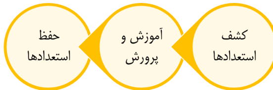
شکل ۴. الگوی حمایت از نخبگان فرهنگی شهر

به نظر می‌رسد، طراحی مسابقات، ایده خوبی برای کشف استعدادها باشد و در مرحله بعد باید برای استعدادهای شناخته شده برنامه‌ریزی کرد و فرایند آموزش و پرورش (در ادامه توضیح داده خواهد شد) را ادامه داد. به نظر می‌رسد، اجرای مرحله بعد که مرحله حفظ استعدادها است، نیاز به همکاری تمام مسئولان شهری و سازمان‌های مربوطه دارد.