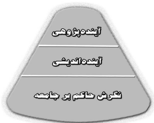
شکل ۱. نظام نگرش - آینده پژوهی

آینده پژوهی بر اساس کار گروهی به پیش می‌رود، برخی از آینده پژوهان بر این باور هستند که می‌توان جدا از دیگران و بدون ارتباط با چارچوب‌های معرفتی و نهادی انسان‌ها فعالیت کرد. اما موارد یاد شده نشان می‌دهند که آینده پژوهی تعاملی و پویاست و در موضوع، هدف، نظریه، داده و... باید با محیط خود به‌طور پیوسته رابطه‌ای دوسویه داشته باشد. بنابراین علم - فناوری آینده پژوهی نمی‌تواند خارج از نظام «نگرش - آینده پژوهی» باشد. پس تحلیل کلان و تغییر در مبانی و بدیل اندیشی برای آینده پژوهی نیازمند آن است که سطح کار از آینده پژوهی به نظام «نگرش - آینده پژوهی» ارتقا یابد. آینده پژوهی، خود نیازمند آینده پژوهی است. برای این منظور نباید به سطح لیتانی آن (آینده پژوهی) بسنده کرد و باید به عمق آن نفوذ کرد. آینده اندیشی و نگرش حاکم بر جامعه، لایه‌های بنیادین آینده پژوهی به شمار می‌آیند.