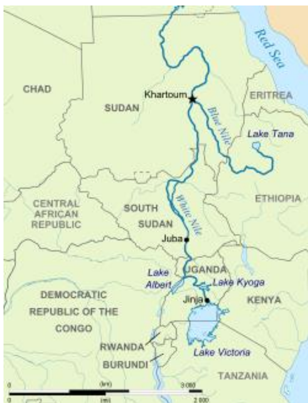
نقشه رود نیل