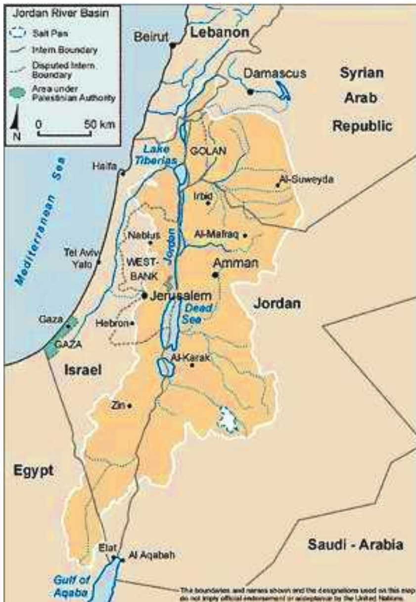
نقشه حوضه رود اردن