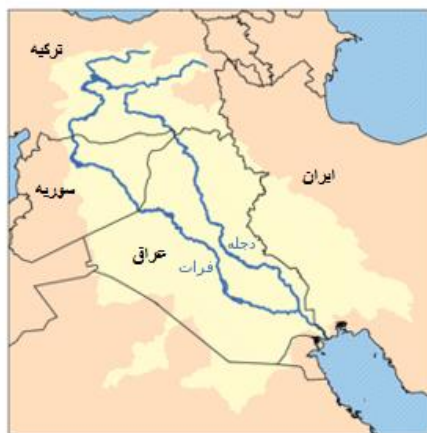
نقشه دجله و فرات

دو رود دجله و فرات همراه با رود نیل، سه رود بزرگ خاورمیانه هستند. منطقه بین دجله و فرات در تاریخ به بین‌النهرین (عراق امروزی) معروف است. این دو رود از جنوب شرقی ترکیه نشأت می‌گیرند. فرات از ترکیه به سمت سوریه و سپس به عراق جریان دارد. دجله از ترکیه نشأت می‌گیرد و مرز بین ترکیه و سوریه در حدود ۳۲ کیلومتر را تشکیل می‌دهد و به سمت عراق جریان دارد و بعضی از شاخه‌های آن به سمت ایران جریان دارد. سرانجام دو رود درون عراق شط‌العرب را تشکیل می‌دهند که انتهای آنها به خلیج فارس می‌رسد. ترکیه مناقشه بزرگی با سوریه و عراق بر سر دو رود دجله و فرات دارد. ترکیه پروژه بزرگ آبی که معروف به پروژه جنوب شرقی آناتولی (GAP) است را اجراء می‌کند. در این پروژه، ترکیه ۲۲ سد و ۱۹ نیروگاه بر روی دو رود می‌سازد. بسیاری از آنها تقریباً احداث شده‌اند و باعث کاهش چشمگیر میزان منابع آب در سوریه و عراق شده است. از آنجایی که این دو رود ۹۸ درصد منابع آب عراق و ۹۰ درصد منابع آب سوریه را تشکیل می‌دهند، بنابراین دو کشور این طرح را تهدیدی بسیار جدی برای منابع آب خود می‌دانند (Abujuub, 2002: 1-5).