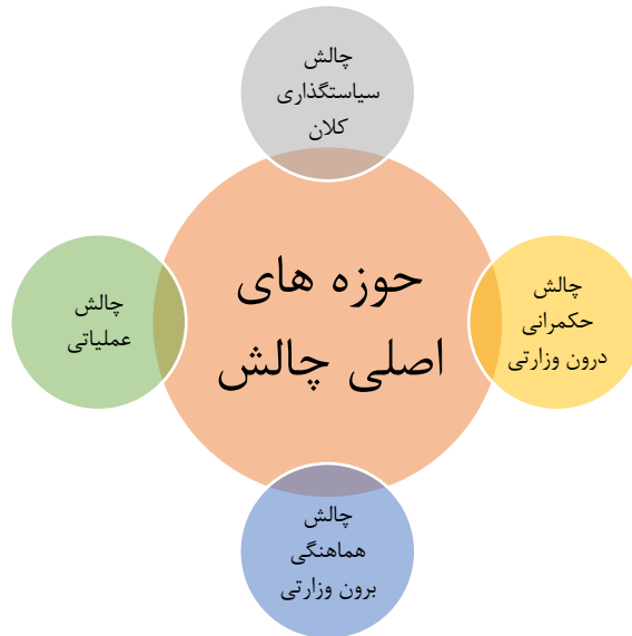
شکل شماره ۱: حوزه‌های اصلی چالش‌های مراکز مرجع همکاری‌های علمی بین‌المللی

در ذیل هر چالش اصلی مجموعه‌ای از زیرچالش‌ها شناسایی شد که بر اساس نظر صاحب‌نظران اولویت‌گذاری به شرح جدول ۲ صورت‌بندی شد.