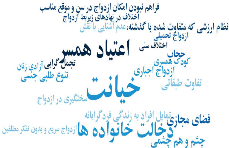
جدول (۴): فرایند فهرست موضوعات و مفاهیم مربوط به علل فرهنگی طلاق

در ذیل ابر واژگان علل اجتماعی طلاق آمده است. همان‌طور که مشاهده می‌شود عللی چون خیانت، اعتیاد همسر و دخالت خانواده‌ها مهم‌ترین دلایل اجتماعی طلاق از منظر صاحب‌نظران است.