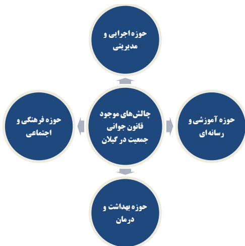
شکل (۱): مجموعه مقولات «چالش‌های موجود قانون جوانی جمعیت در گیلان»