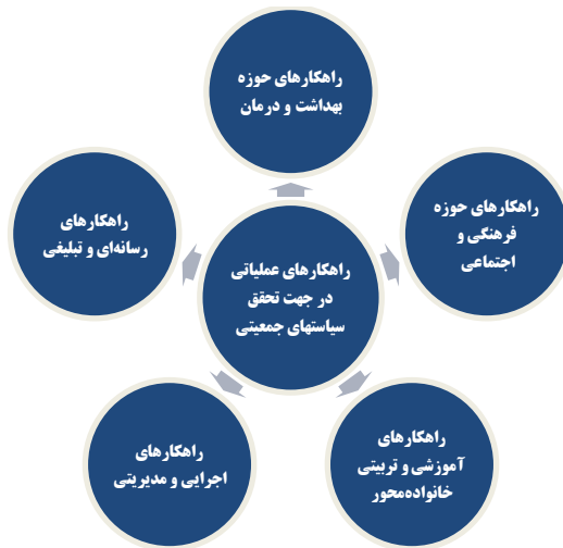
شکل (۲): دسته‌بندی راهکارهای عملیاتی در جهت تحقق سیاست‌های جمعیتی

پس از احصاء مسائل و خلأهای موجود در قانون و چالش‌ها و موانع اجرای قانون، مهم‌ترین راهکارهای عملیاتی متناسب با نظام مسائل حوزه جمعیتی در استان ضمن گفتگو و مصاحبه با کارشناسان و نخبگان حوزه مطالعات جمعیتی استخراج و در پنج حوزه مورد نظر ذیل، جهت کاربست در حوزه سیاست‌گذاری جمعیتی و رفع موانع تحقق و اجرای سیاست‌های جمعیتی و قانون حمایت از خانواده، ارائه گردید.