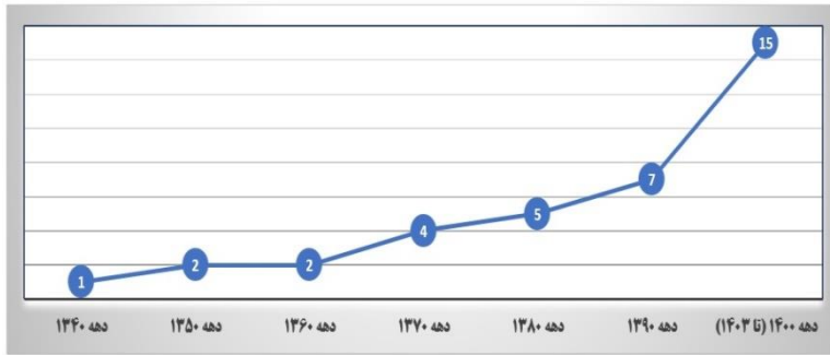
نمودار (۱): سیر زمانی اسناد برنامه‌های راهبردی در بررسی متمرکز مرتبط با رویکرد الهیات تمدنی

قابل تعریف هستند. به‌طور کلی، چهار نوع شیوه پرداختن به مسائل اجتماعی عبارت‌اند از: پژوهش بنیادی، پژوهش تکنیکی، تحلیل سیاست و سیاست‌پژوهی (ماژرزاک، ۱۳۹۸، صص. ۱۵ و ۱۶). در گام نخست (به شیوه توصیفی) با استفاده از روش نمونه‌گیری تمام‌شماری، تمامی اسناد قابل دسترس از طریق سامانه قوانین و مقررات مرکز پژوهش‌های مجلس شورای اسلامی طبق کلیدواژه‌های مستخرج از مبانی نظری مقاله بررسی و سپس در گام دوم (به شیوه تحلیلی) با روش نمونه‌گیری هدفمند و متمرکز محتواها انتخاب و تحلیل (تحلیل گزاره‌های استنباطی) شدند. کلیدواژه‌های بررسی شده عبارت‌اند از: «تمدن، شرق، غرب، دین، معنوی، ارزش، اعتقاد، الهی، خدا، اسلام، الهیات، فقه، فقیه». در نهایت، یافته در پرتو سیر تاریخی بحث تاکنون تفسیر و ارائه شدند. در این وهله، اسناد مرتبط در دوره پیش از انقلاب ۳ مورد و در دوره پس از انقلاب ۳۴ مورد را شامل می‌شدند. نمودار زمانی و جدول زیر جزئیات بررسی را نشان می‌دهد: