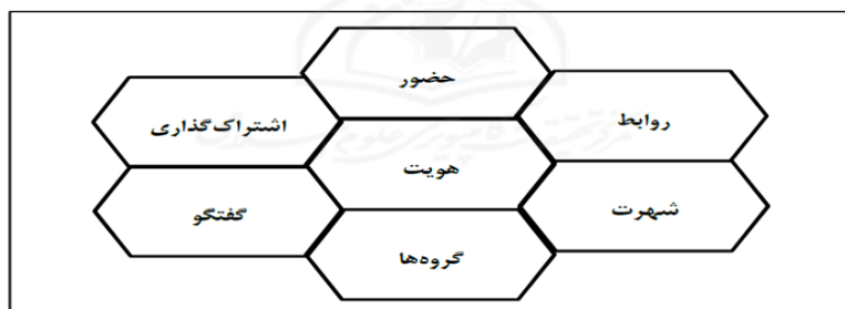
شکل ۱: مدل کندوی عسل از اسمیت

۷. گروه‌ها: بعدی که کاربران با هم دارای ارتباط جمعی هستند و همچنین خودشان را پرزنت (عرضه) می‌نمایند و نشان می‌دهند که چقدر محبوب هستند (Kietzmann, 2011: 248).