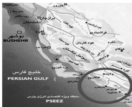
شکل ۱. محدوده منطقه مورد مطالعه